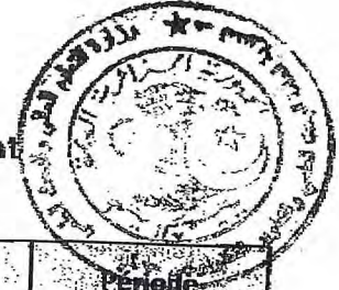
Tableau des établissements d'enseignement supérieur à couvrir par le Centre de Développement des Energies Renouvelables-CDER