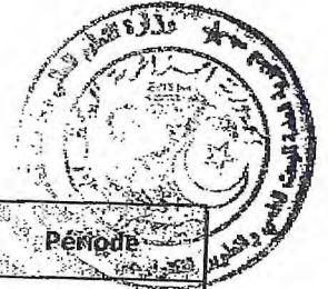
Tableau des établissements d'enseignement supérieur à couvrir par le Centre de Développement des Technologies Avancées-CDTA